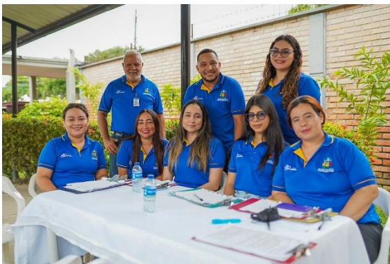
Reflejo de la imagen corporativa en el marco del fortalecimiento institucional

Esto, a su vez, repercute positivamente en la calidad de los servicios ofrecidos, aumentando la satisfacción y confianza de los ciudadanos . La implementación de nuevas tecnologías y metodologías moderniza la entidad, permitiendo una gestión pública más innovadora y orientada a la satisfacción de las necesidades de la comunidad. En conjunto, estos efectos contribuyen a una administración pública más eficiente, transparente y alineada con el bienestar de la comunidad.