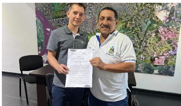
Beneficiario del programa de promoción de vivienda (vivienda nueva)