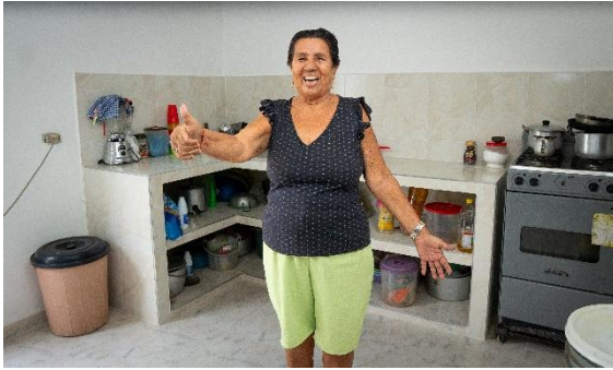
Beneficiaria del programa de mejoramiento de vivienda saludable