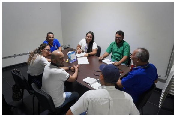
Reunión institucional de planeación y seguimiento a los procesos misionales de la entidad