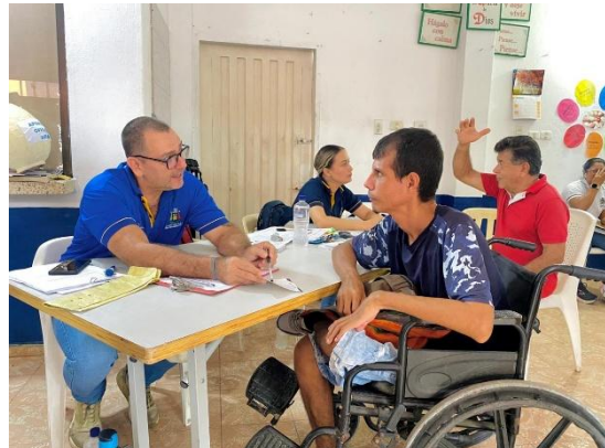
Jornada de atención al público y acompañamiento comunitario