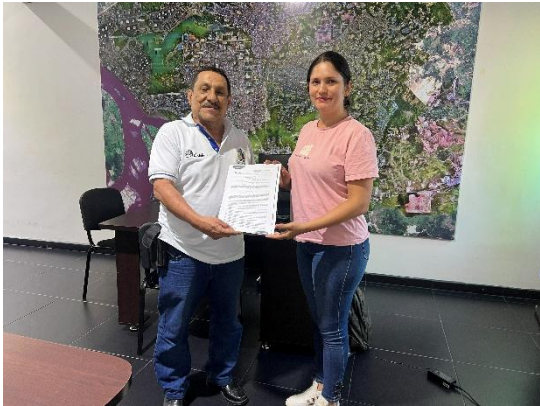
Beneficiaria del programa de promoción de vivienda (vivienda nueva)

promueve un entorno más estable y seguro para la comunidad, lo que a su vez puede tener efectos positivos en la economía local y la cohesión social.