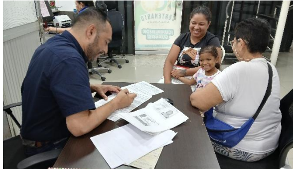
Jornada de atención al público y acompañamiento comunitario