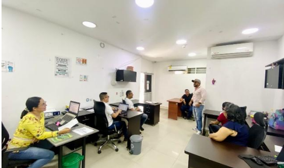
Espacio interno de fortalecimiento institucional

SOCIAL DE BARRANCABERMEJA - EDUBA. BARRANCABERMEJA - BPIN: 20240000007083”.