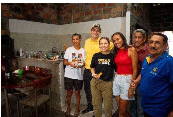
Jornada de entrega de obras del programa mejoramientos de vivienda saludable

Este proyecto también promueve la dignidad y el bienestar de las familias beneficiarias, al proporcionarles medios para vivir en condiciones adecuadas. La mejora de las viviendas no solo impacta positivamente en la salud y seguridad de los residentes, sino que también contribuye a la cohesión social y al desarrollo económico local, al incentivar la participación comunitaria y la generación de empleo en el sector de la construcción y la mejora de infraestructuras.