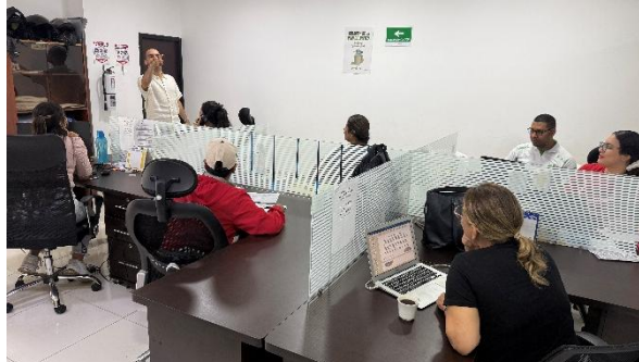
Espacio interno de fortalecimiento institucional