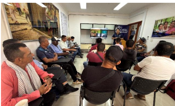
Jornada de atención al público y acompañamiento comunitario