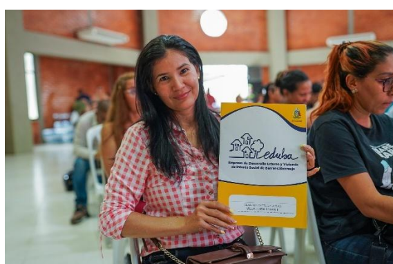
Beneficiaria del programa de titulación de predios gratuita