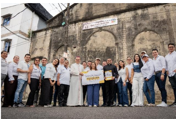
Histórica entrega de titulación a la primera iglesia católica de Barrancabermeja

El programa de Titulación de Predios ha permitido que 124 familias de escasos recursos que los han ocupado de manera ilegal con vivienda de interés social y han ejercido posesión material obtengan un título jurídico que los acredita como propietarios mediante la inscripción en la Oficina de Registro de Instrumentos Públicos.