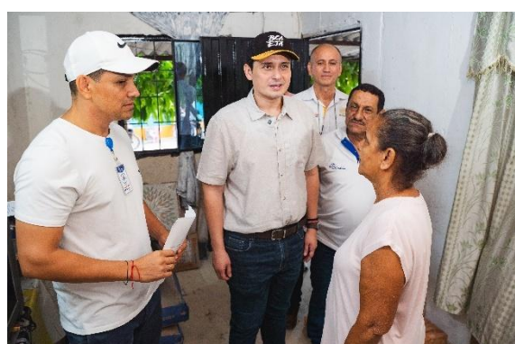
Jornada de seguimiento de obras del programa mejoramientos de vivienda saludable

En adelante se presentan las principales acciones desarrolladas por la Secretaría Distrital de Planeación durante la vigencia 2025, organizadas por cada uno de los programas implementados.