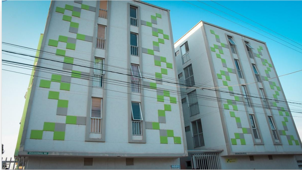
Torres de Avars: 42 Subsidios de Vivienda