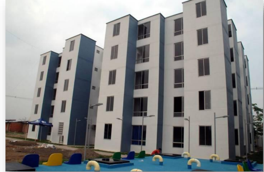
Colinas del Norte: 80 Subsidios de Vivienda